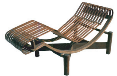
シャルロット・ペリアン《竹製シェーズ・ロング》 1941年/1985年再制作、Cassina

本展では、シャルロット・ペリアンと、彼女が愛した「日本」との関わりを軸に、家具、インテリアに関する図面、写真や資料など約500点を紹介し、ペリアンと日本人とのあいだの感性の共鳴とその波及をたどります。今なお愛され続けるペリアンの作品と創造の人生を振り返ることは、今後の建築やデザインのあり方を考える絶好の機会となるでしょう。