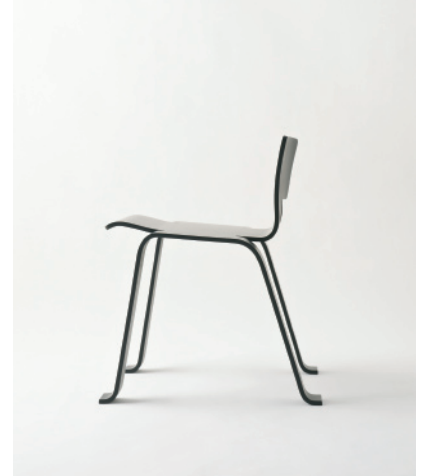
シャルロット・ペリアン《オンブル(影)》1954年 Photo: Shizuka Suzuki

© Archives Charlotte Perriand— ADAGP, Paris & SPDA, Tokyo, 2012