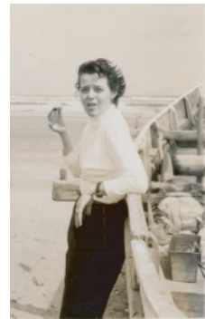
シャルロット・ペリアン、銚子海岸にて 1954年