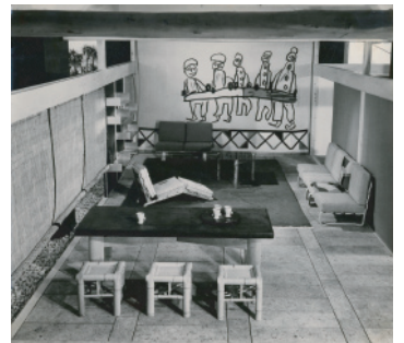
「選擇 傳統 創造」展 高島屋会場、東京、1941年

伝統への敬意と同時に未来へのまなざしを持ち、常に前へ進んでいったペリアン。最後の章では、彼女が唱えた「生きる芸術」をキーワードに、ペリアンの生前最後の展覧会となった1998年に日本で開催された「シャルロット・ペリアン 20世紀のパイオニア展」の資料ほかでペリアンの足跡を振り返ります。