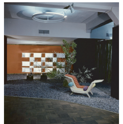
「芸術の総合への提案—ル・コルビュジエ、レジェ、ペリアン三人展」高島屋会場、東京 1955年