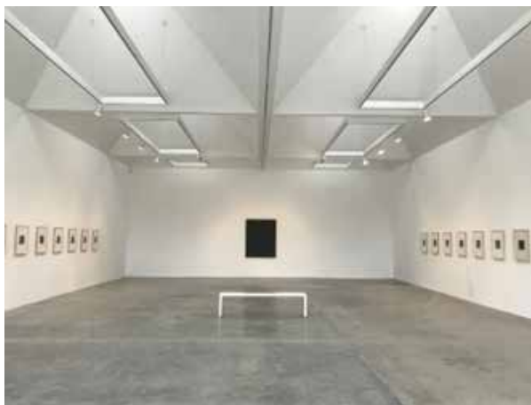
⑨ 村上友晴個展会場風景 Tomoharu Murakami 2017年11月18日-2018年1月6日 Kayne Griffin Corcoran, LA/USA