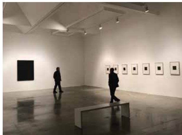
⑩ 村上友晴個展会場風景 Tomoharu Murakami 2017年11月18日-2018年1月6日 Kayne Griffin Corcoran, LA/USA