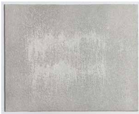
⑦ 無題 2016 鉛筆・ニードル / 紙 24.2 x 30.3 cm