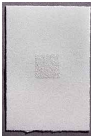
⑤ 十字架の道 2001 ドライポイント・ニードル / 紙 22.0 x 15.3 cm 14点組