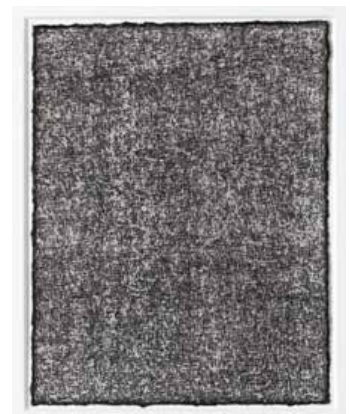
⑥ 聖夜 2007 墨・油彩・鉛筆・鉄筆 / 紙 19.1 x 15.1 cm