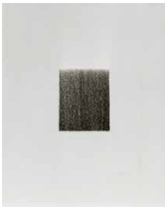
④ PSALM I (詩篇) 1979 ドライポイント / 紙 30.5 x 24.5 cm 8点組