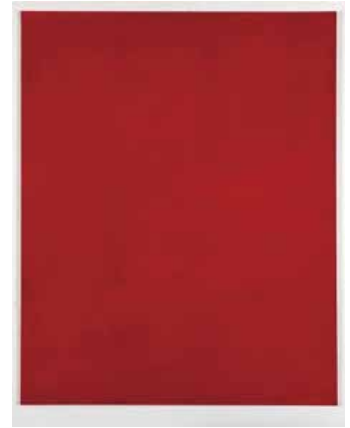
③ 無題 1980 透明水彩 / 紙 62.5 x 50.7 cm