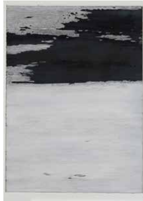
② 無題(礼文) 1986 油彩・アクリル / 紙 61.9 x 45.2 cm