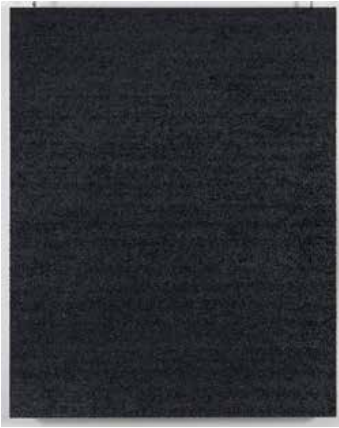
① 無題 1998・1999 油彩 / キャンバス 100号 162.0 x 130.0 cm