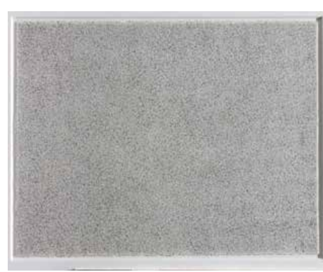
⑧ 無題 2018 鉛筆・ニードル / 紙 19.0 x 25.0 cm