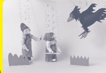
①《ボングラッツ人形 ベビー》1980年代～/エリザベス・ボングラッツ/ドイツ ②《陶磁器人形 ローズ》2001年/シルヴィア・ナテラ/オーストリア ③《ケテ・クルーゼ人形》1990～2000年代/ケテ・クルーゼ社/ドイツ ④《マリオネット カラス》など1980年代/ベアリング社/スイス ⑤《指人形家族》1960～2010年代/ヘアヴィック社/ドイツ ⑥《ケルナースティック》1920年代～/ケルナー社/ドイツ ⑦《ハンドパペット「赤ずきん」》など1980年代/ベアリング社/スイス