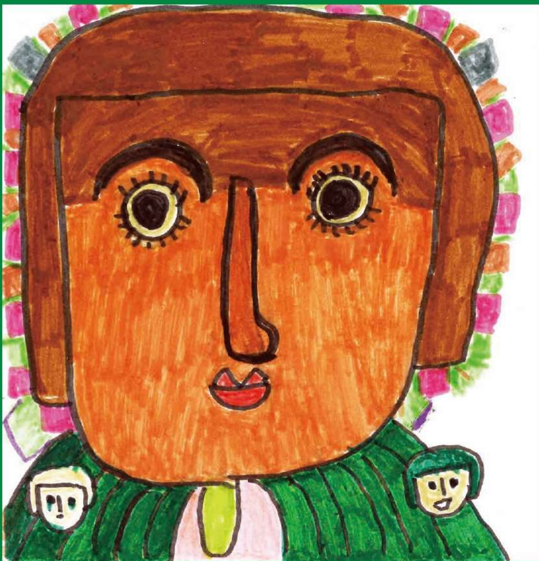
エイ子《ようこそおいで》