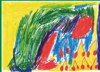
加親子《さくらんぼ食べました》

Artists with Disabilities in Meguro "Our Daily Joy 2024"