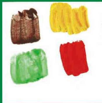
保田粒人《びーまん》