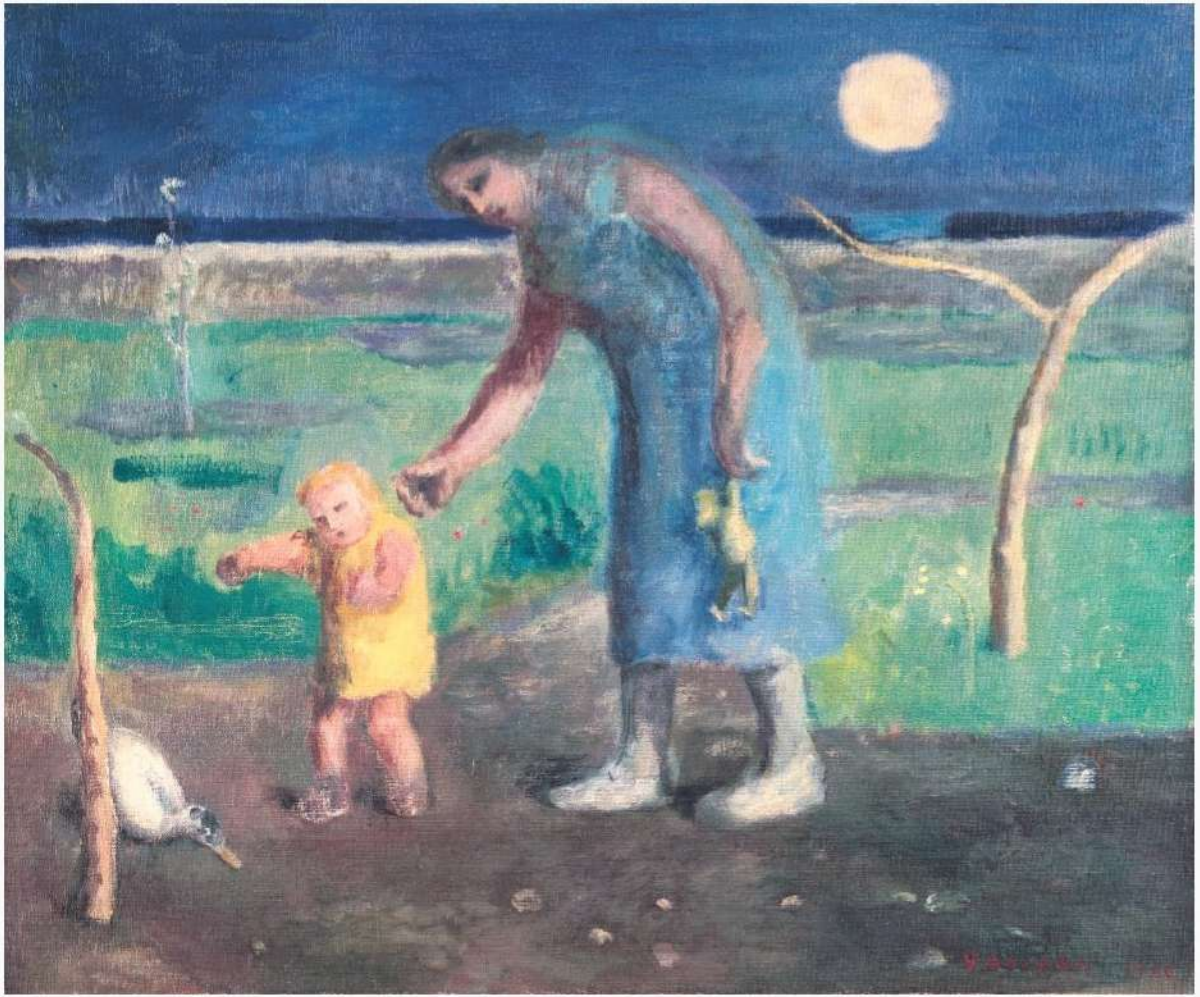
青山義雄《母と子》 1926年 油彩・キャンバス 46.3×55.4cm 目黒区美術館蔵