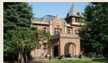
旧前田侯爵邸(洋館)