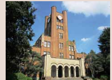
東大駒場キャンパス

お申込み 締切り：10月2日(金)必着 (応募多数の場合は区民を優先して抽選) お申し込み先：文化・交流課 詳細は裏表紙下部をご覧ください。