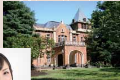
旧前田家本邸(洋館)