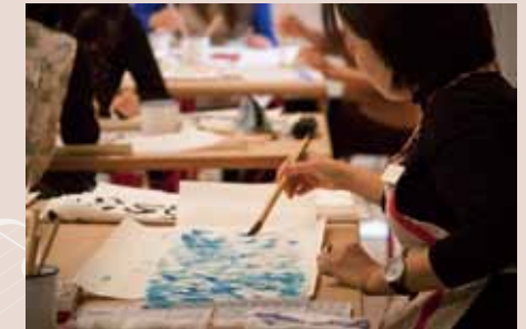
過去のワークショップの様子

お申込み 9月28日(月)から、先着順で受付開始 お申し込み先：文化・交流課 詳細は裏表紙下部をご覧ください。