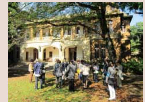
過去の建築めぐり塾の様子

お申込み 締切り：10月2日(金)必着 (応募多数の場合は区民を優先して抽選) お申し込み先：文化・交流課 詳細は裏表紙下部をご覧ください。