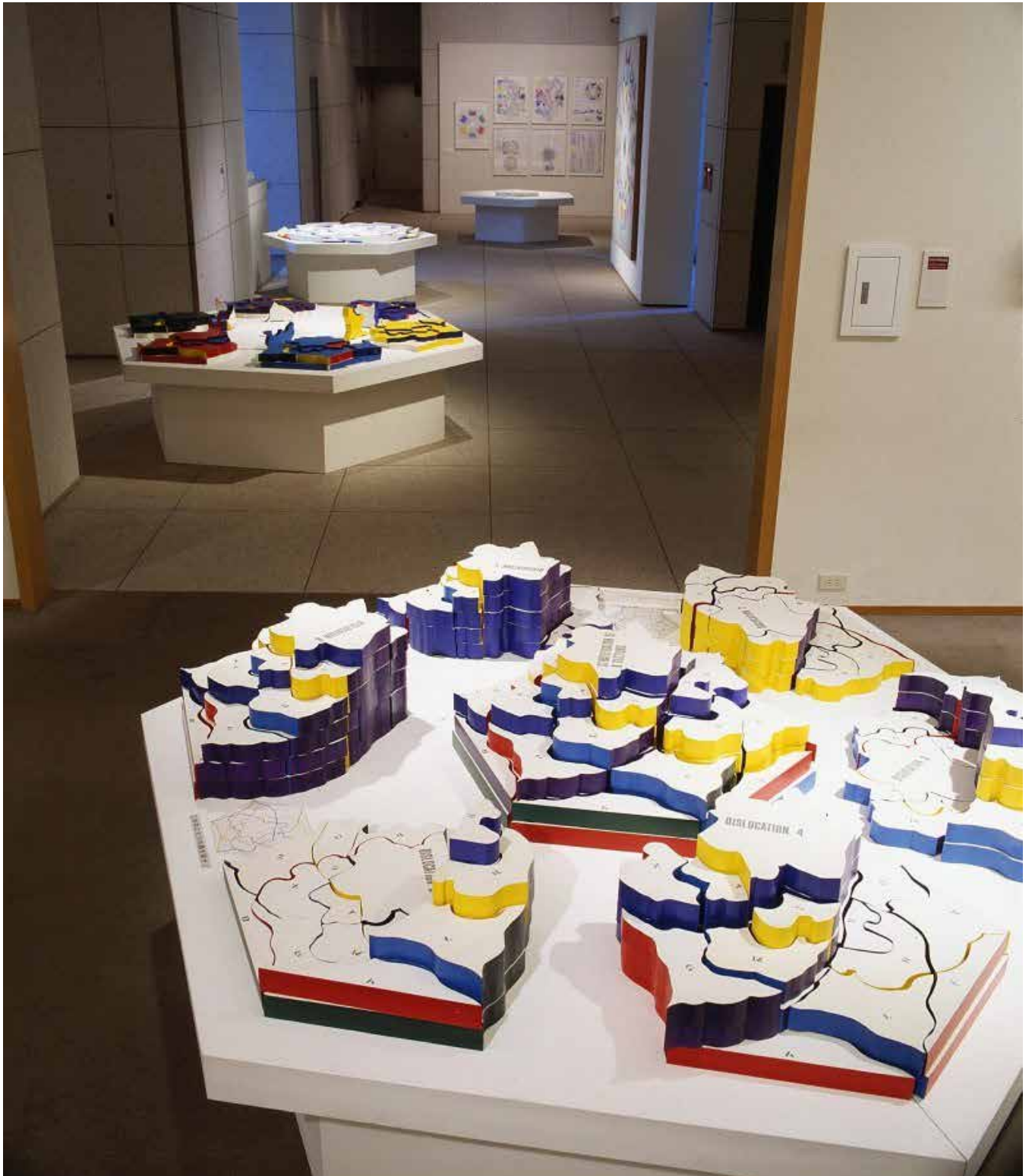
宇佐美圭司《Ghost Plan in Process: Profiles》1972年 | 目黒区美術館での展示風景(1992年)

主催 | (公財)目黒区芸術文化振興財団 目黒区美術館 協賛 | (公財)北野生涯教育振興会