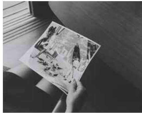
高松次郎《写真の写真》より「ネガ番号015」 1973-91年 ゼラチンシルバープリント