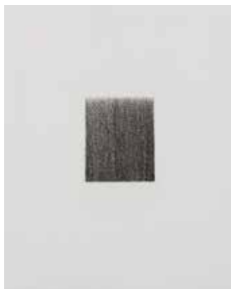
村上友晴《Psalm 1》より 1979年 ドライポイント・紙