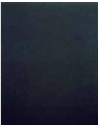
村上友晴《無題》 1985-87年 油彩・キャンバス