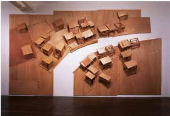
川俣正《プロジェクト「ピープルズ・ガーデン」—ドキュメンタ IX、カッセル1992》より「マーケット」 1992年