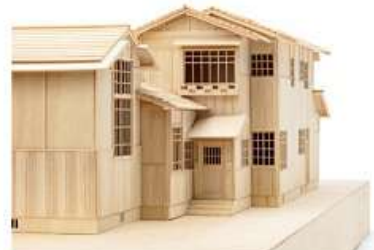
《太田邸模型》2019年／制作:二星大輝 協力:松隈洋研究室 京都工芸繊維大学