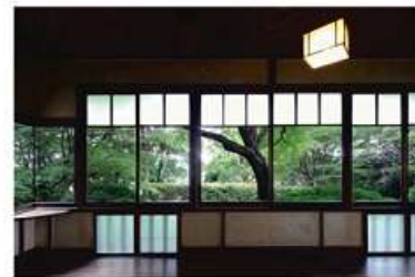
藤井厚二《聴竹居 縁側》1928年