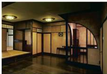
藤井厚二《聴竹居 居室》1928年