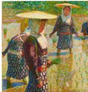
太田喜二郎《田植》1916年 東京国立近代美術館