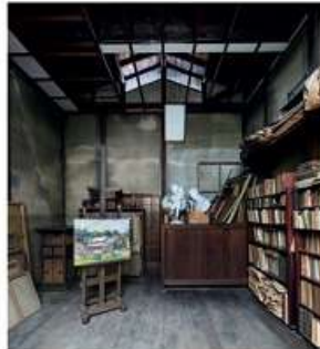
藤井厚二《太田邸新画室(アトリエ)》 1924年竣工 1931年増改築