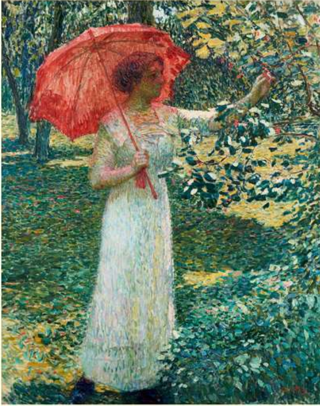
太田喜二郎《赤い日傘》1912年 新潟大学